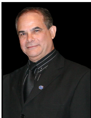
Ex-Presidente do Sindicato dos Contabilistas de Belo Horizonte 2007/2010