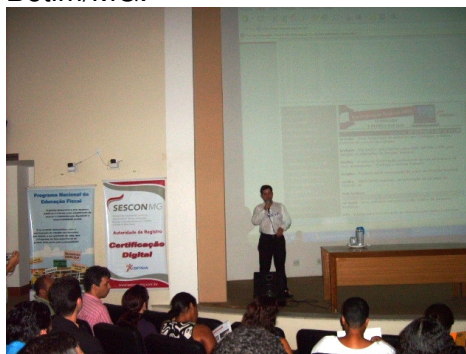
Circuito de Debate do mês de Maio

Local: Auditório do CDL/Betim – Rua Vicência Maria de Jesus, nº 375, Jardim das Cidades - Betim/MG.