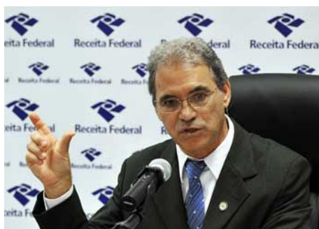
Supervisor Nacional do Imposto de Renda, Joaquim Adir

Uma obra indispensável para os que apoiam integralmente a convergência do Brasil às normas do IASB e para aqueles que se posicionam de forma crítica ou cautelosa. Boa fonte de consulta e referência aos pesquisadores do tema.